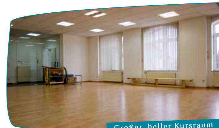
Großer, heller Kursraum